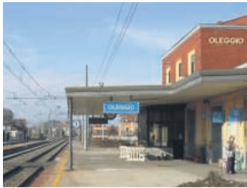
"Scompaiono" i treni degli orari di punta

A esasperare gli utenti nelle ultime settimane sono le sempre più frequenti sostituzioni dei treni con autobus: uno spostamento che da tabella di marcia dovrebbe durare circa quindici minuti si prolunga anche per un'ora. Così nei giorni scorsi è stata avviata una sorta di petizione che ha già superato il centinaio di nomi di pendolari di tutta la tratta: «Dal 1° marzo alcuni treni sono letteralmente spariti – spiega una delle promotrici, Chia-